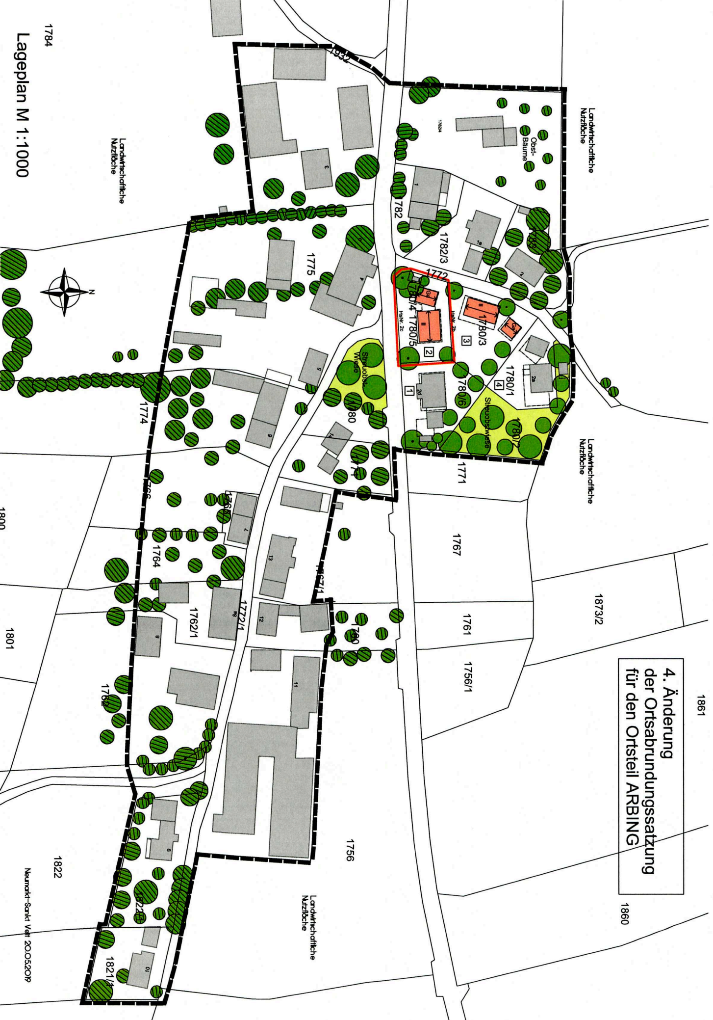
Lageplan M 1:1000