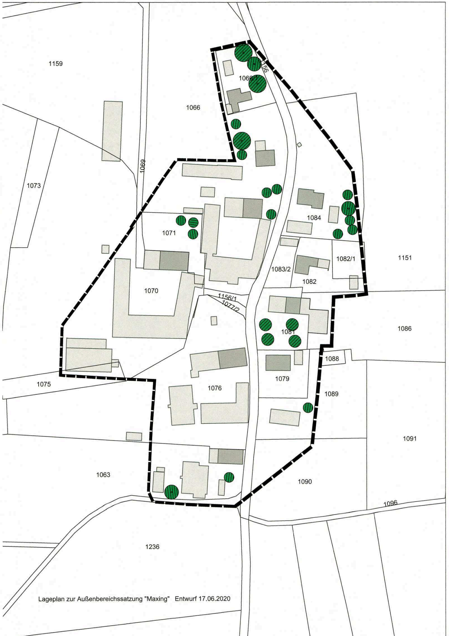
Lageplan zur Außenbereichssatzung "Maxing" Entwurf 17.06.2020